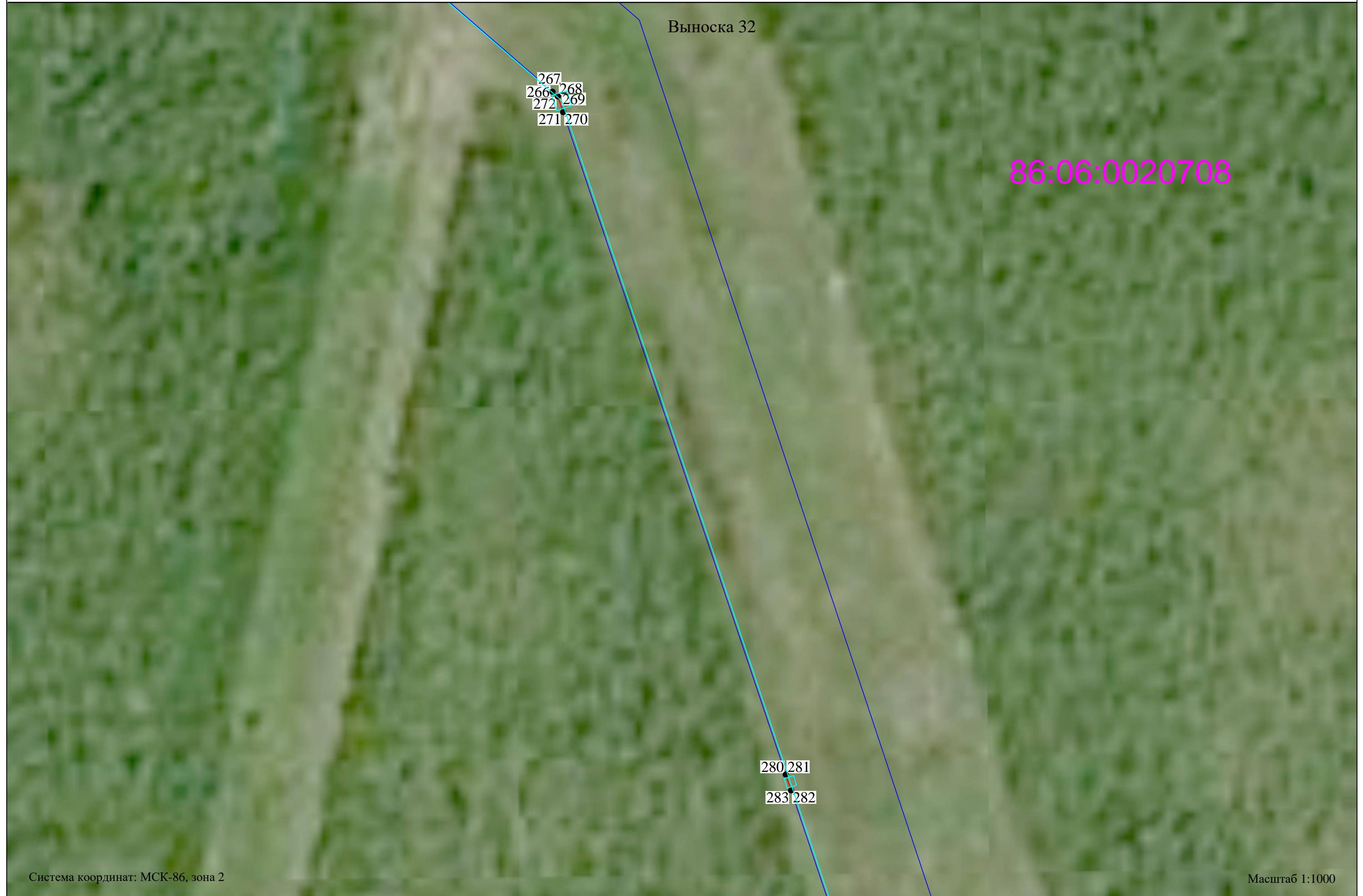
Схема расположения границ публичного сервитута Публичный сервитут, устанавливаемый в целях размещения (эксплуатации) объекта регионального значения "Отпайка высоковольтной линии-110кВ на подстанции "Бобровская" 2 цепь (ВЛ-110кВ "Белоярская (Н.Казым)-Перегибное" 2 цепь)"