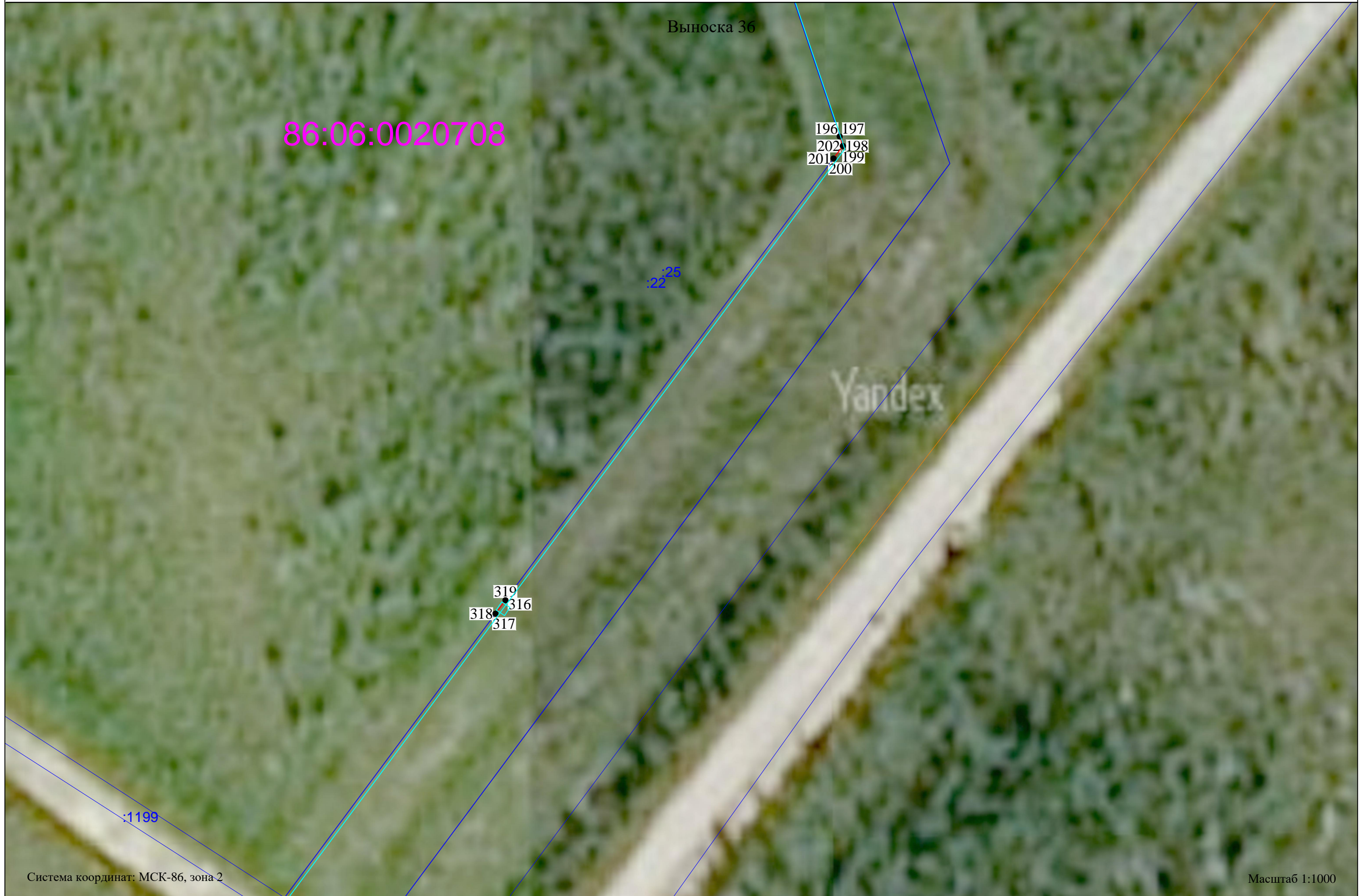
Схема расположения границ публичного сервитута Публичный сервитут, устанавливаемый в целях размещения (эксплуатации) объекта регионального значения "Отпайка высоковольтной линии-110кВ на подстанции "Бобровская" 2 цепь (ВЛ-110кВ "Белоярская (Н.Казым)-Перегребное" 2 цепь)"